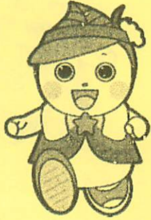
北区健康まちづくり キャラクター「ぼっぴい」